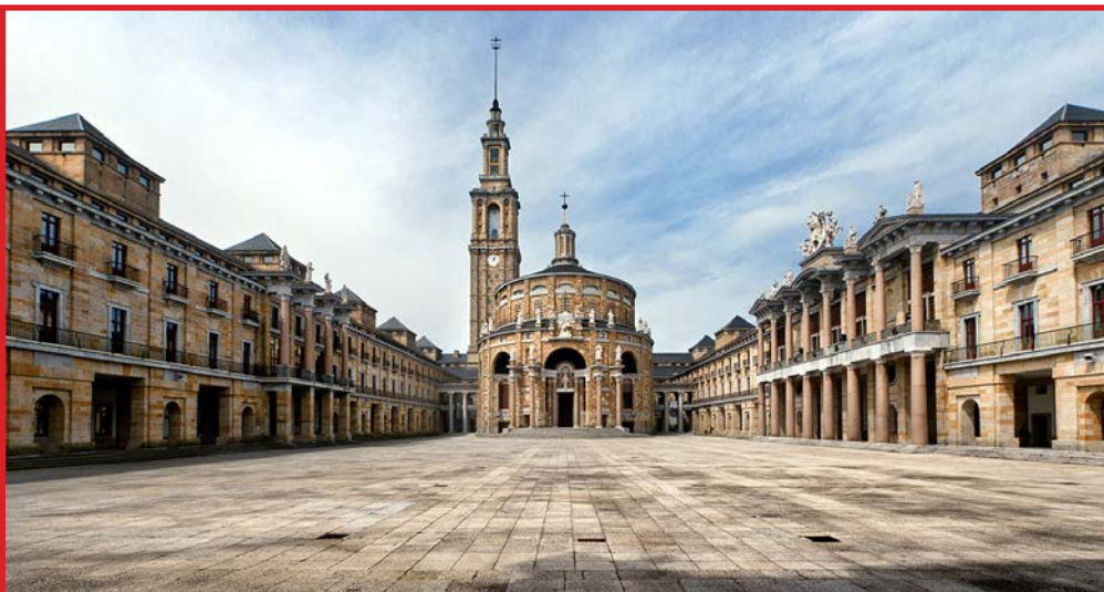
Vista exterior de Laboral Ciudad de la Cultura

AsturFranquicia, Feria de la Franquicia en Asturias, organizada por Working Comunicación y con la colaboración activa de AFyEPA, Asociación de Franquicias y Emprendedores del Principado de Asturias, celebrará su VI Edición los días 1 y 2 de diciembre en Laboral Ciudad de la Cultura en Gijón.