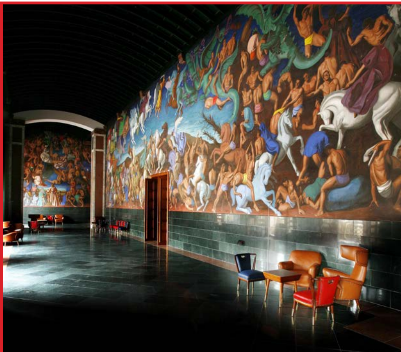
Vista de la Sala de Pinturas de Laboral Ciudad de la Cultura

AsturFranquicia , Feria de la Franquicia en Asturias, celebrará los días 1 y 2 de diciembre de 2017 en Gijón su VI Edición. Este evento es el encuentro profesional de referencia en Asturias entre centrales franquiciadoras, consultoras especializadas en franquicia y emprendedores e inversores interesados en adherirse al Sistema Comercial de Franquicia.